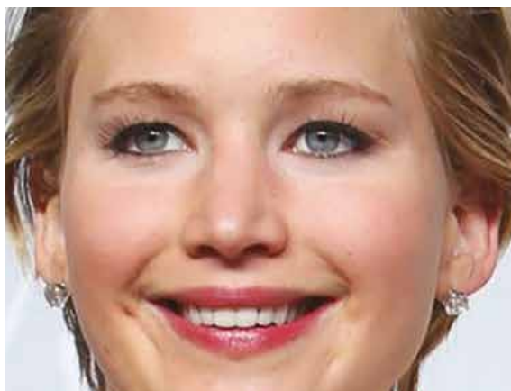
Gli occhi incappucciati di Jennifer Lawrence