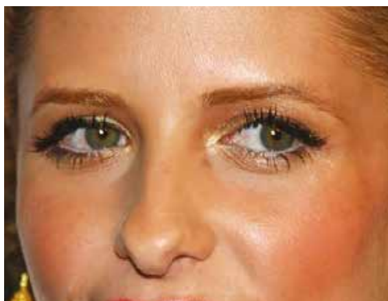
Gli occhi spioventi di Sarah Michelle Gellar

omogenea di ombretto medio-scuro, da sfumare fino a mezzo centimetro sotto le sopracciglia . I colori scuri infatti "restringono" e "fanno arretrare" (quindi minimizzano l'eccesso di pelle e la sporgenza). Evitate ombretti molto chiari e perlati che danno il risultato opposto, cioè accentuano la sporgenza e l'eccesso di pelle. L'occhio incappucciato difficilmente riesce a portare bene matita occhi o eyeliner perché la palpebra superiore li copre e tendono a pasticciarsi, oltre a risultare invisibili. Anche il mascara potrebbe sporcare la palpebra mobile superiore se messo a partire dalla radice, meglio limitarlo alle punte.