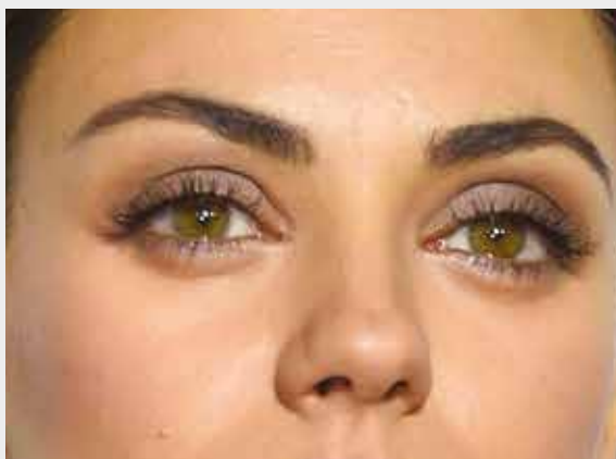
Gli occhi sporgenti di Mila Kunis

L'attrice Jennifer Aniston ha occhi di questa tipologia. Colori scuri e linee nette non sono "amici" degli occhi piccoli, che al contrario vogliono un sapiente equilibrio di luci e ombre per essere ingranditi e un lavoro di definizione più che altro delle ciglia, tanto da far sembrare l'occhio più aperto e grande. Se oltre ad essere piccoli i vostri occhi sono anche ravvicinati, è importante usare solo un ombretto avorio da stendere omogeneamente dalla caruncola lacrimale e fino a metà occhio: i colori chiari infatti ingrandiscono e allontanano. Nel solco tra la palpebra mobile e quella fissa sfumerete un colore medio. Definiteli con una linea infra-ciliare di matita solo sopra e impregnate bene ciglia per ciglia di mascara, insistendo sulla radice e poi allungando verso le punte e lateralmente, in modo da ottenere