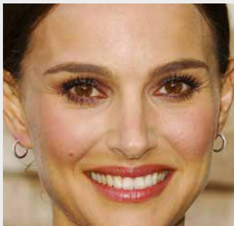
Gli occhi a mandorla di Natalie Portman

Le sopracciglia vanno pettinate verso l'alto, riempite lì dove vedete buchi con un ombretto dello stesso colore oppure con una matita, ed eventualmente fissate con della cera se sono folte e ribelli. Il riempimento con l'ombretto risulta più naturale e soft , con la matita risulta più definito e pieno. Non assottigliate troppo le vostre sopracciglia, quando sono folte e ben disegnate ringiovaniscono il viso perché ricordano quelle di una giovane ragazza: se ricordate, da adolescenti non strappavate le sopracciglia e il vostro arco era probabilmente più pieno di adesso.