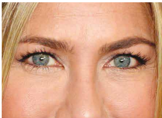
Gli occhi piccoli e ravvicinati di Jennifer Aniston

quell'effetto "cerbiatto" che apre e allunga l'occhio verso l'esterno. Palpebra mobile mantenuta chiara e luminosa , contro-bilanciata da una leggera ombra tra la palpebra fissa e quella mobile e da abbondante mascara trasformeranno questo tipo di occhio!