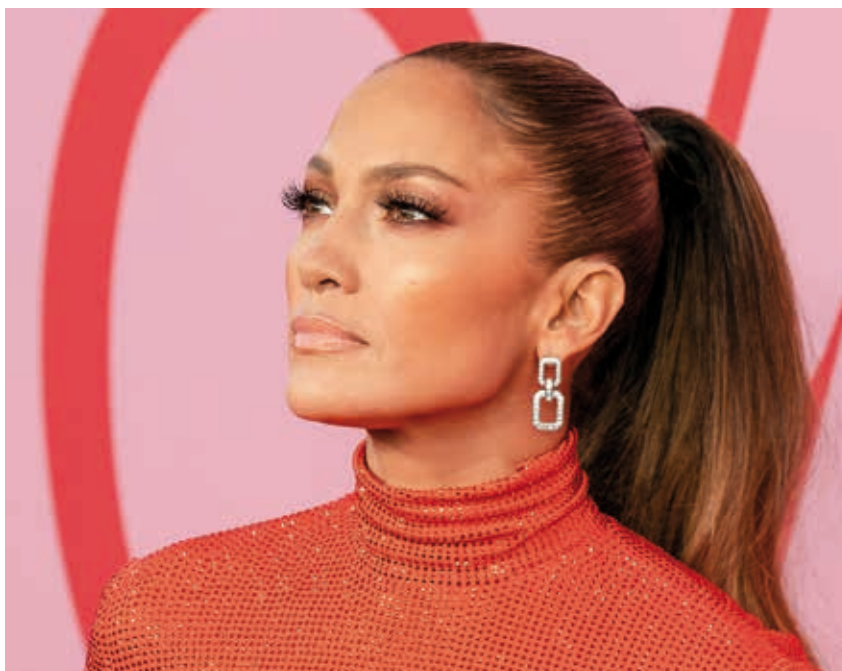
Jennifer Lopez appartiene alla stagione Autunno scuro ed è valorizzata da colori caldi e corposi come l'arancione zucca, i bronzo e i nude caldi per il make-up.

ha donato, con i colori degli indumenti, degli accessori e del make-up! L'ho sperimentato con esito positivo su centinaia di persone e ancora oggi, la magia che la consapevolezza dei propri colori 'amici' porta alle persone mi stupisce e affascina come la prima volta che l'ho sperimentato su me stessa."